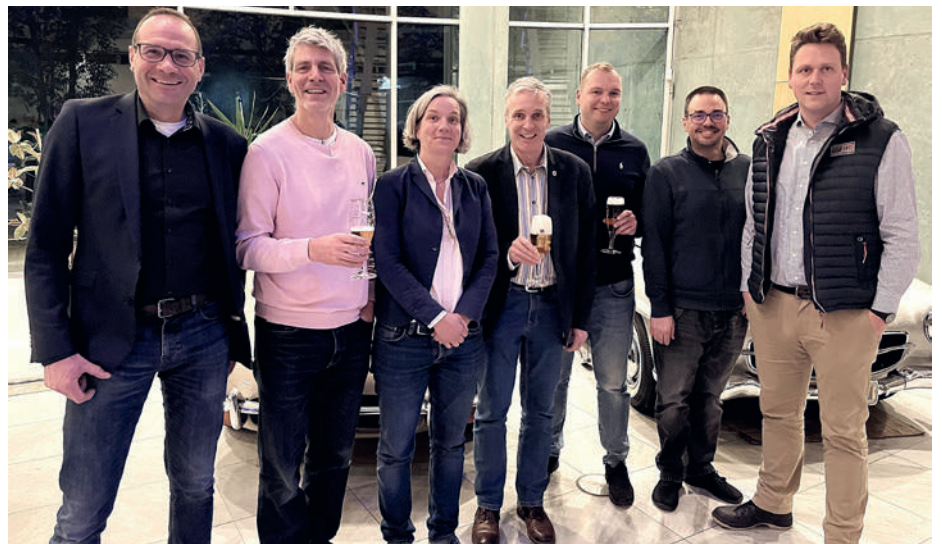
Der neue Vorstand der Landesgruppe Hessen