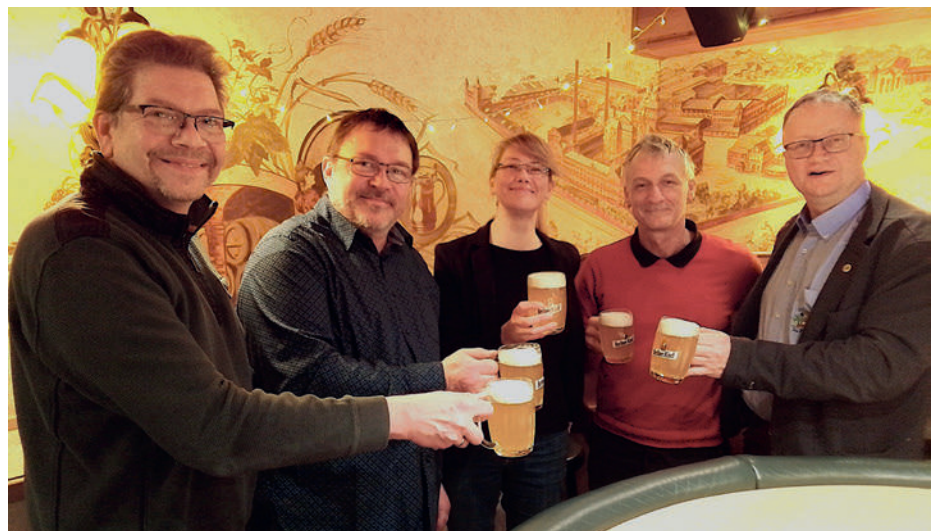
Der neu gewählte Vorstand