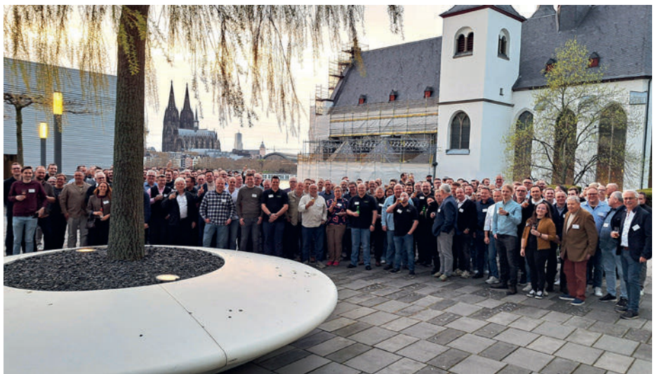
Gruppenfoto am LanXess-Tower mit Blick zum Kölner Dom.