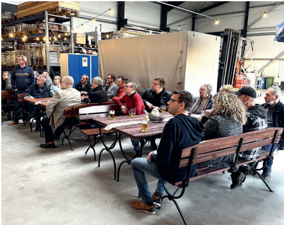
Die Teilnehmer bei der Firma Müller in Eldingen