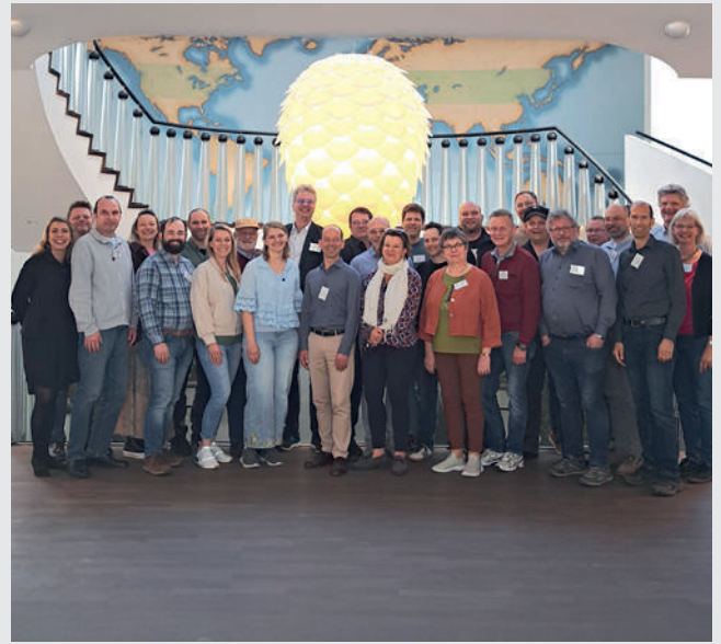
Die Teilnehmer und Referenten der Fachtagung der Fachlehrer bei BarthHaas in Nürnberg