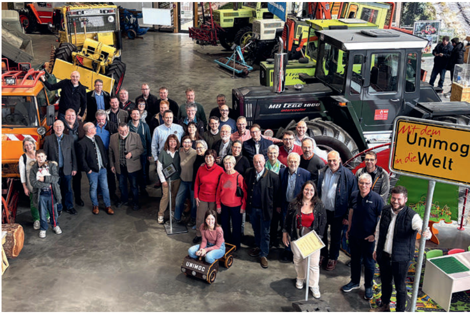
Die Teilnehmer im Unimog Museum

de die Funktionsweise der Photometer im Detail beschrieben. Ein Hauptbestandteil des Vortrages war jedoch ein Einblick in die vielfältigen Einsatzmöglichkeiten der Photometer im Brauprozess. Die Einsatzmöglichkeiten wurden detailliert, kurzweilig vom Sudhaus bis in die Füllerei beschrieben und aufgezeigt.