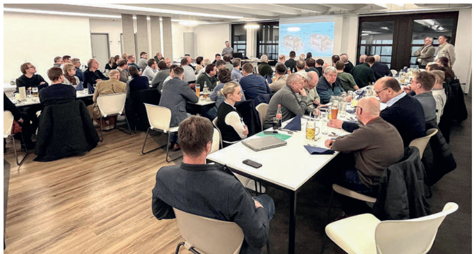
Die Teilnehmer bei einem Fachvortrag