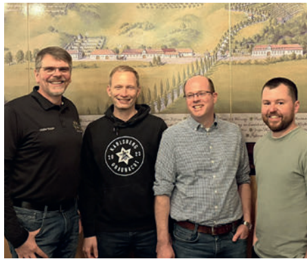
Der alte und neue Vorstand

Im Rückblick wurde auf verschiedene Veranstaltungen des Jahres 2025 verwiesen. Dazu zählten unter anderem Stammtische sowie die Teilnahme an überregionalen