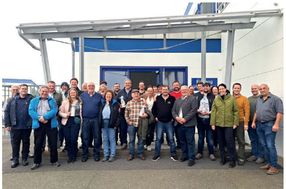
Die Teilnehmer vor der Firma Rauh