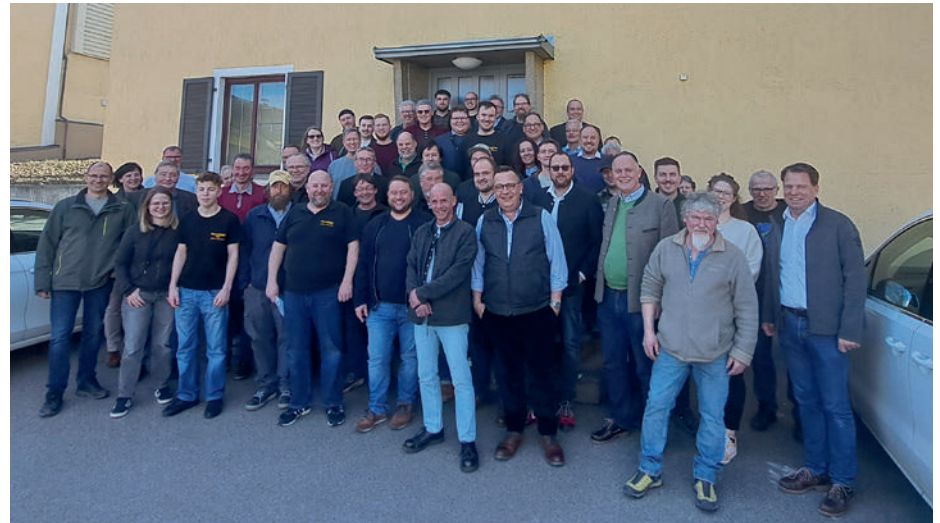
Die Teilnehmer der Brauereiführung

dazu wurde ein Partnerprogramm in Form einer Stadtführung durch die historische Altstadt von Aalen angeboten.